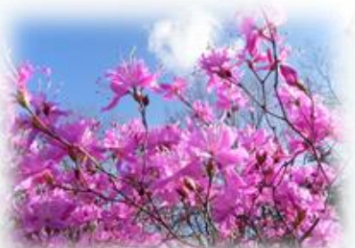
コスモホーム玄関前のミツバツツジ