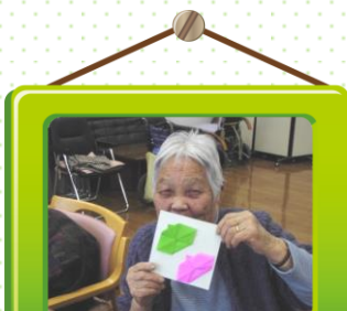
初めて雛人形を折りました♪