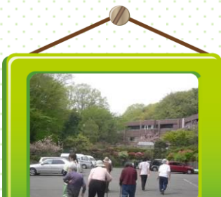
園庭散策で下肢筋力維持！

通所介護では年間を通して色々な活動を行い、楽しい取り組みで生活の活性化を図っています。プログラムは、食事会・ドライブ・園庭散策等の屋外での活動。また、小物作り・折り紙工作・塗り絵・書道・脳のトレーニング・身体を動かすレクリエーション・体操等、室内での活動を取り入れています。その中の、活動の一部を写真でご紹介します。