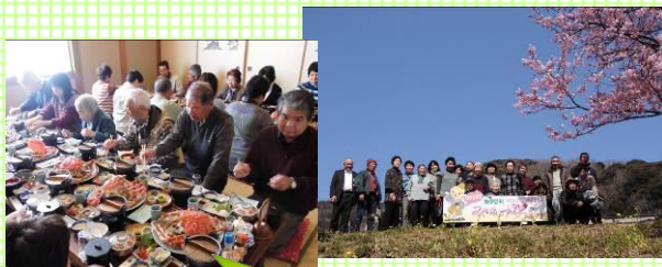
写真は H25 年度バスハイク 河津桜見物と高足が「堪能の旅

1/14(水)佐野厄除け大師詣でとイチゴ狩り(とちおとめ) 3/25(水)春の館山、花と海鮮グルメツアー