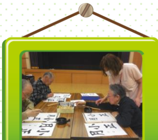
書道の時間。実力は健在です！