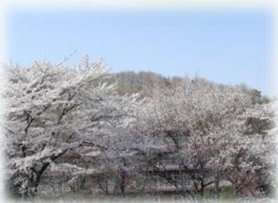
コスモホーム前の桜